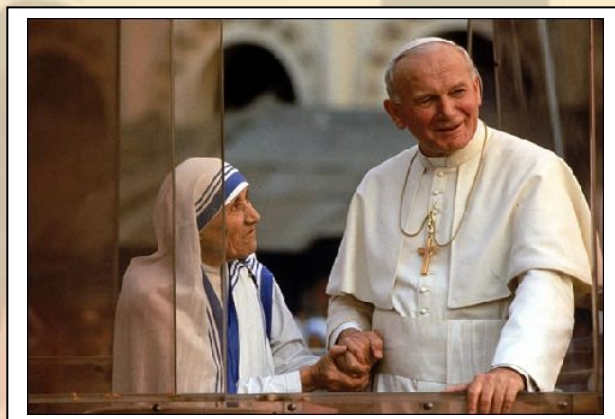
'Dove guarda, vede' (L'odore dell'India, 1961 –Pier Paolo Pasolini).

Molte persone scambiano le Sorelle per assistenti sociali, ma non lo sono. Non ricevono proventi né dalla Chiesa né da alcun governo. Il voto di povertà, nello spirito di dedicare a sé stesse il tempo minimo indispensabile e dedicarlo il più possibile alle persone bisognose, ed il servizio gratuito al più povero implica che esse vivano della generosità e delle offerte di chiunque abbia qualcosa da donargli: cibo, soldi, medicinali, vestiti o anche solo un po' del proprio tempo per aiutarle ad occuparsi dei più poveri tra i poveri.